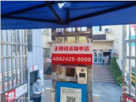
设计制作防疫宣传海报及新时代文明实践中心内氛围打造