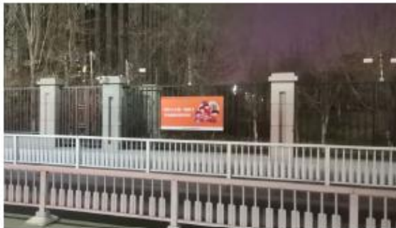
水区主干道制作 未成年人公益广告展板