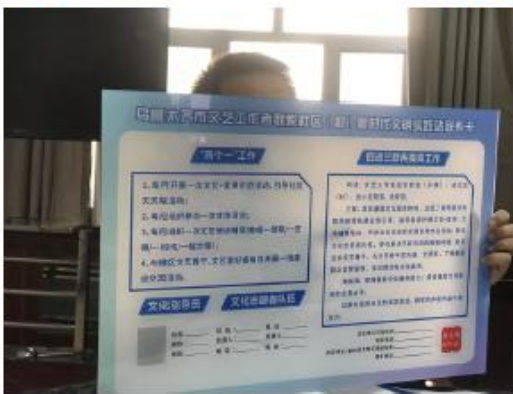
制作新时代文明实践站服务卡及工作手册